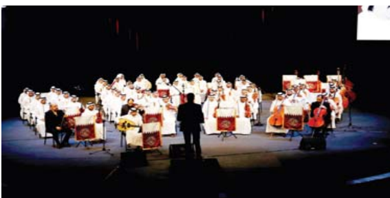
● كتيبة موسيقى القوات المسلحة تؤدي سيمفونية عبد العزيز ناصر

✪ الحق لا يعيش في ظل الاستبداد ولا ينتصر إلا بالحرية