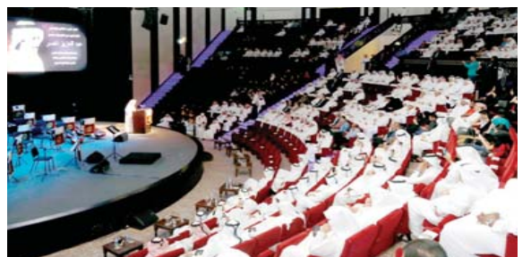
● جانب من الحضور